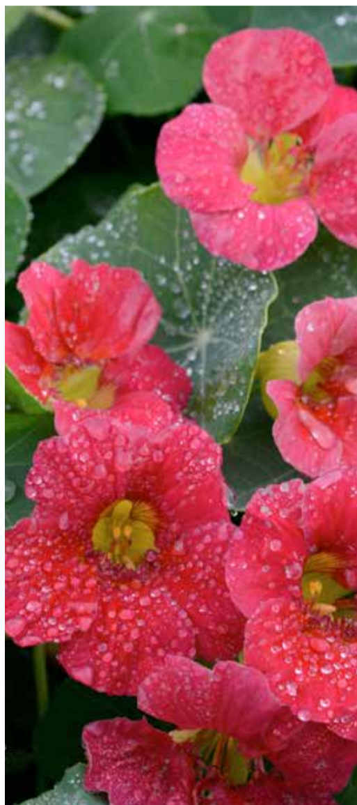
» Doskonały materiał jest nieodzowny w pracy fotografa

Kolekcja jest własnością firmy APP Wiedeń, a zatem gwarantuje pełną swobodę podejmowania decyzji każdego wymiana i otwiera rynki całego świata. Wszyscy goście branżowi mają świadomość czasu pracy, poświęcenia i samozaparcia, aby w tak krótkim czasie stworzyć tak obszerną fototekę.