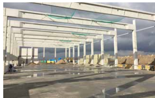
» Jeden z etapów budowy