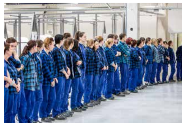
» Liczna załoga wita gości

Do realizacji zleceń firma dysponuje 4.000 m 2 , z tego około 3.600 m 2 powierzchni produkcyjnej i 400 m 2 powierzchni administracyjnej. Maksymalne zatrudnienie w sezonie można rozszerzyć do 120 osób na produkcji i 30 w administracji. Obecnie pracuje około 100 pracowników.