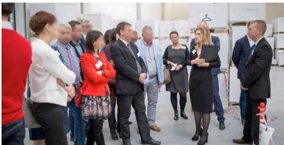
» Wiceprezes oprowadza jedną z polskich grup