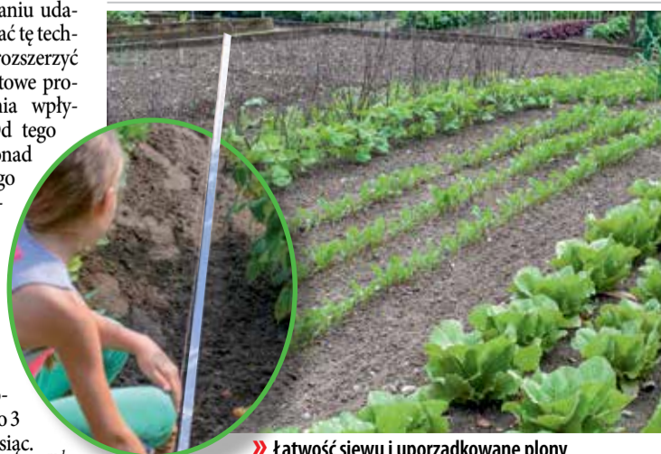
» Łatwość siewu i uporządkowane plony