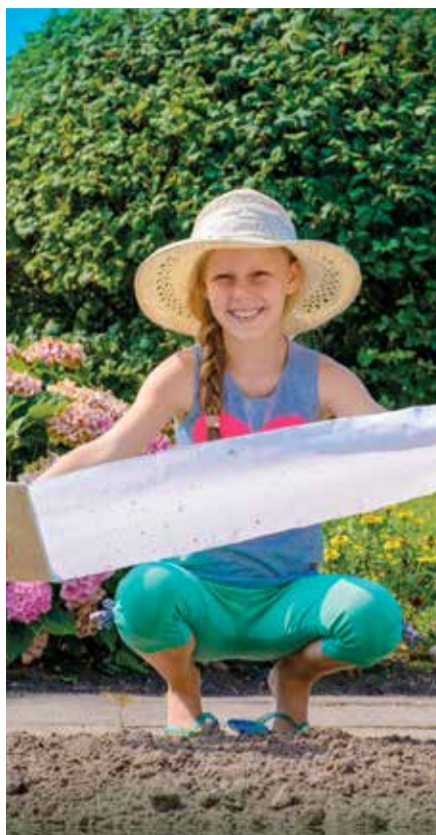
» Wstęga z nasionami na rabaty

Również w zakresie medialnej promocji wspólnych produktów, oprócz kontynuacji rozszerzania fototeki, APP dysponuje ciekawymi pomysłami, których póki co, zarząd nie chce zdradzić.