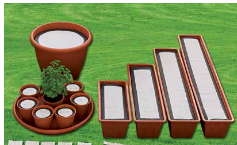
» Różne, wygodne formy rozłożenia nasion na celulozie