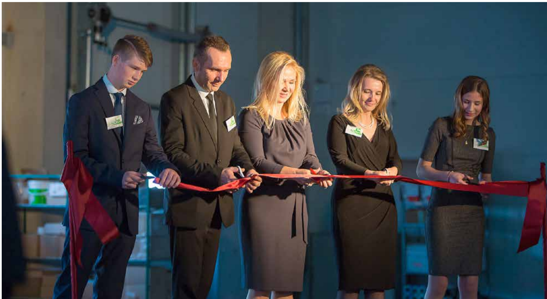
» Uroczyste przecięcie wstęgi przez zarząd APP i dzieci właścicielki

SEED PACKAGING AND SERVICE PROVIDER FOR YOUR CONVENIENCE