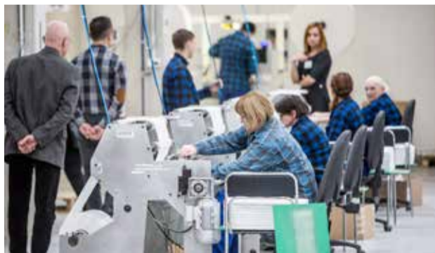
» Goście mogli zajrzeć w tajniki produkcji taśm nasiennych

Dzięki zaangażowaniu udało się nie tylko opanować tę technologię, ale również rozszerzyć ją o oryginalne, unikatowe procesy. Pierwsze zlecenia wpłynęły w roku 2013. Od tego czasu wykonano ponad 50.000.000 sztuk tego produktu. W konsekwencji rozszerzono moce produkcyjne do parku 6 maszyn głównych i 14 obróbkowych, a na tym nie koniec. Możliwości przerobowe wynoszą dziś już 40.000 jednostek na zmianę - czyli do 3 milionów sztuk na miesiąc.