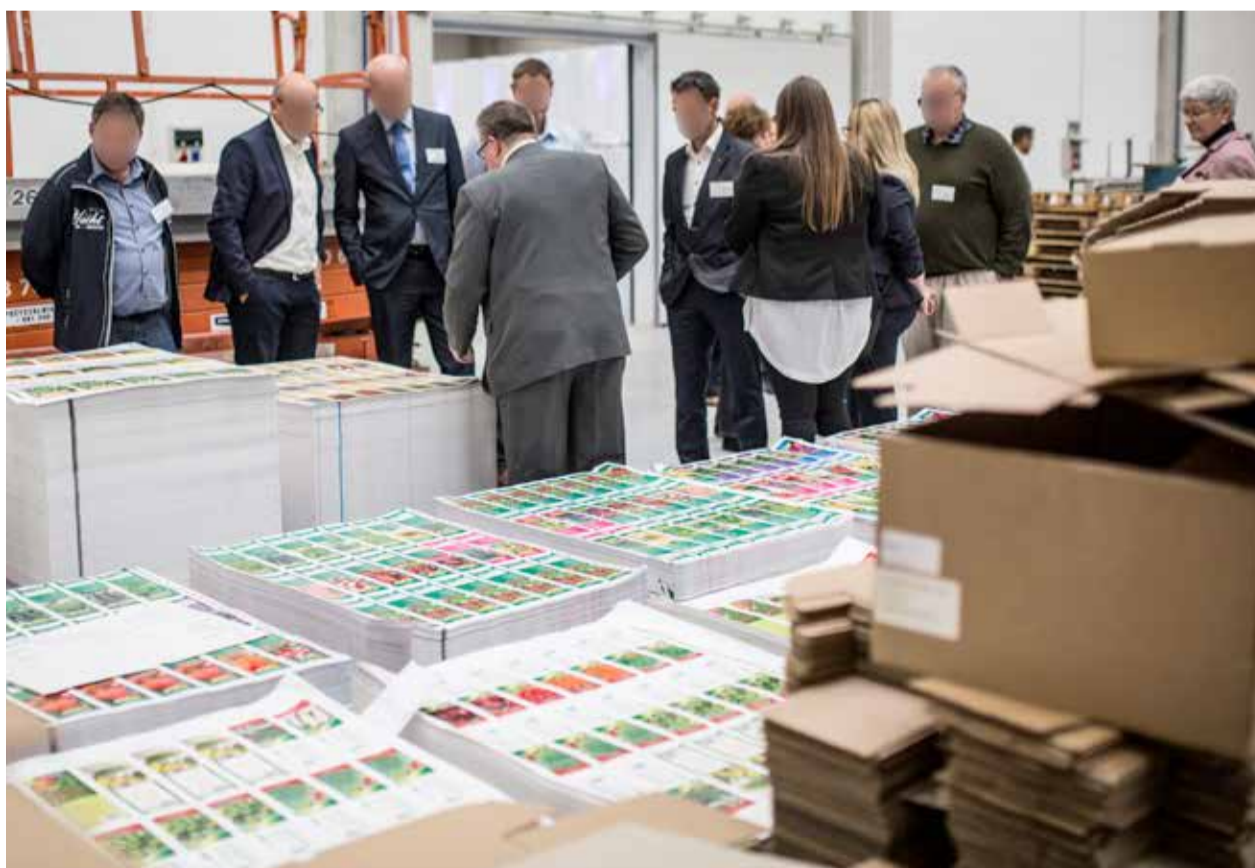
» Goście z dużym zainteresowaniem przyglądali się produkcji torebek do nasion