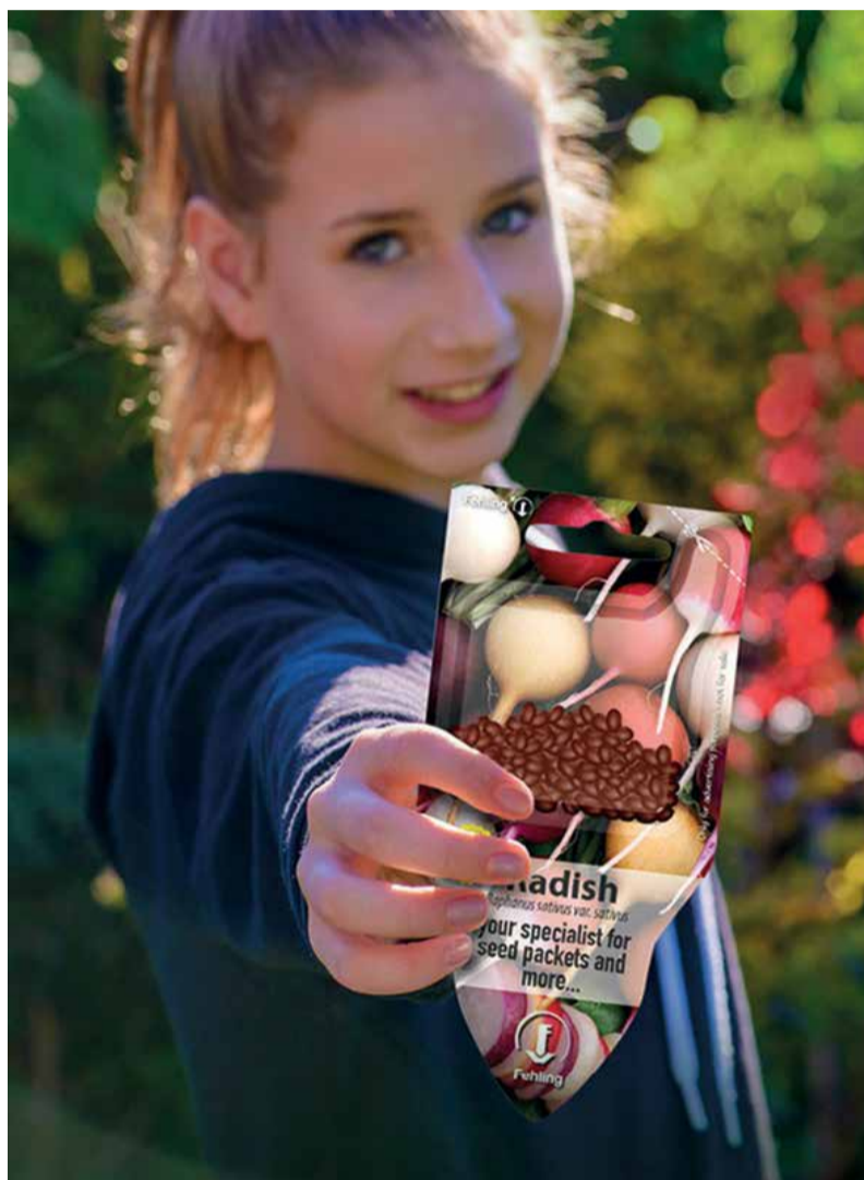
» 3F-3-funkcjonalne opakowanie do nasion